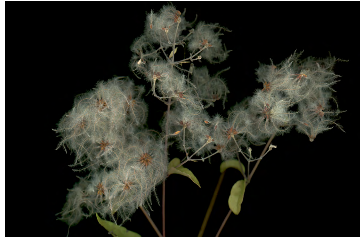
Achim Mohné, DI_GI_TA_LIS – A Plant Scan Project , 2020

Ich glaube, Kunst/Fotografie sollte sich nicht als Maschinenfetischismus zeigen und auch nicht als apotheotisches Verhältnis zum Bild. Das auszuloten hat mich an den Blümchenbildern gereizt, dem Plant Scan Project . Hier steckt diese Vergötterung (der Pflanze) automatisch drin, aber ich wollte hier ganz andere Dinge vermitteln. Die Grundidee war eigentlich: wie politisch ist das Essen? Welche Auswirkung hat Fleischkonsum? Über 50% [Laut IPCC bis zu 37%] der Klimaprobleme liegen hier begründet, wir könnten das alles größtenteils mit Verzicht auf Fleisch regeln. Ein hoch ästhetischer Ansatz ist hier eine Möglichkeit, zumindest der Versuch, Alternativen zum Fleischkonsum aufzuzeigen, indem längst vergessene, essbare Pflanzen wieder ins (Scanner)Licht gerückt werden und somit Beachtung erfahren.