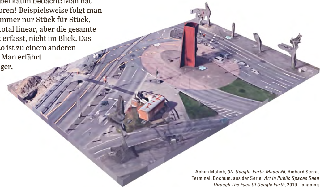
Achim Mohné, 3D-Google-Earth-Model #6, Richard Serra, Terminal, Bochum, aus der Serie: Art In Public Spaces Seen Through The Eyes Of Google Earth , 2019 – ongoing